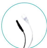
Conectores para Estímulo e Injeção de Fármaco