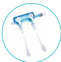
Extensão com Conexão Luer Lock